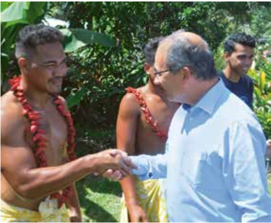
En el programa de viaje también había encuentros con Obispos y Apóstoles