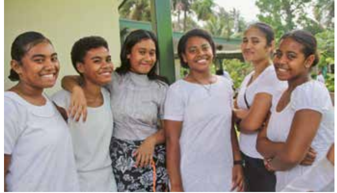
El Apóstol Mayor visitó a hermanos y hermanas en la fe en cuatro países diferentes y celebró cinco Servicios Divinos