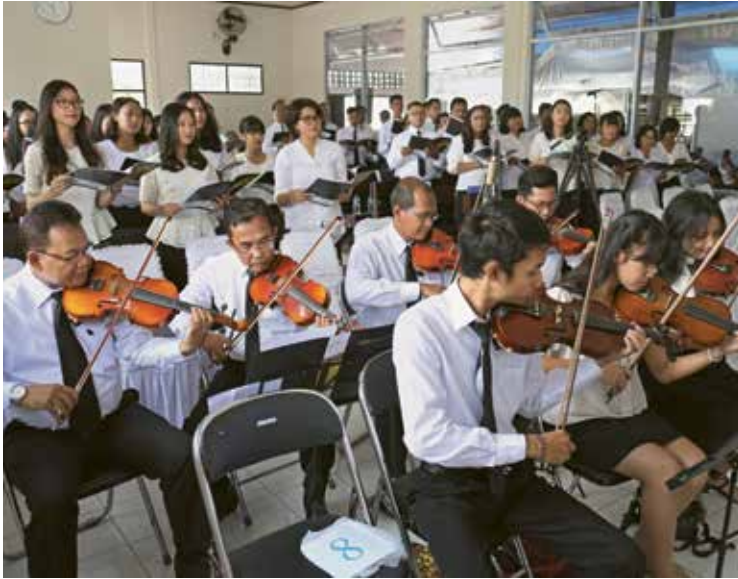
Más de 300 hermanos y hermanas en la fe celebraron el Servicio Divino con el Apóstol Mayor Schneider. Por la mañana lo saludaron con una ceremonia tradicional