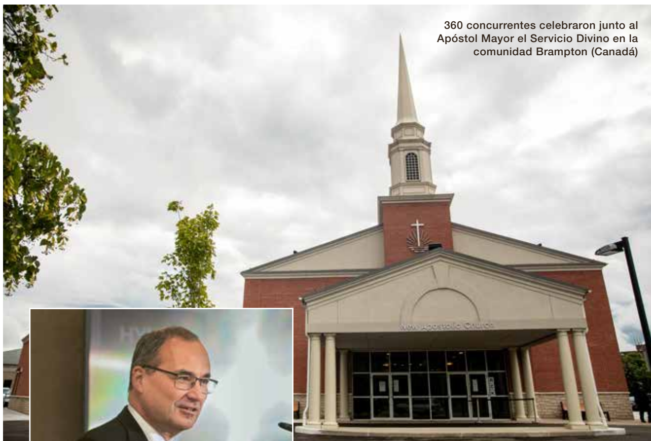
360 concurrentes celebraron junto al Apóstol Mayor el Servicio Divino en la comunidad Brampton (Canadá)