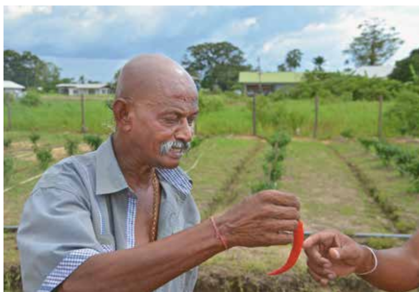
Un profesional conocedor del ají picante da su visto bueno a la cosecha

Además, Stichting Corantijn puso en valor un edificio gubernamental ubicado en la vecindad directa de la Iglesia y pudo desarrollar un notable plan de aprovechamiento junto con el Anciano del pueblo: en el edificio con 2000 metros cuadrados de superficie se instalaron hasta fines de 2018 un jardín de infantes, dos salas de reuniones para jóvenes con biblioteca y salón de computación, dos viviendas para el maestro del pueblo y un salón para secado del ají picante.