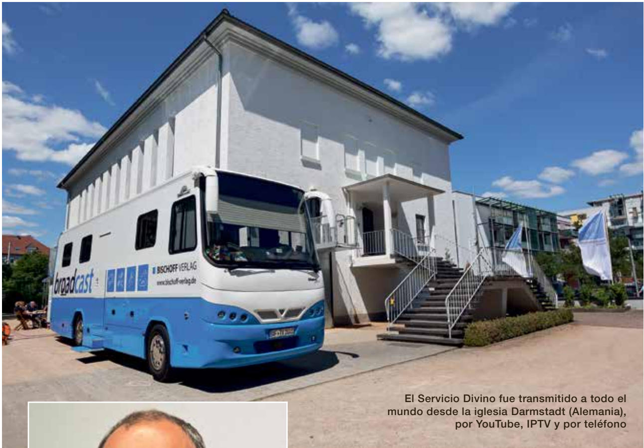
El Servicio Divino fue transmitido a todo el mundo desde la iglesia Darmstadt (Alemania), por YouTube, IPTV y por teléfono