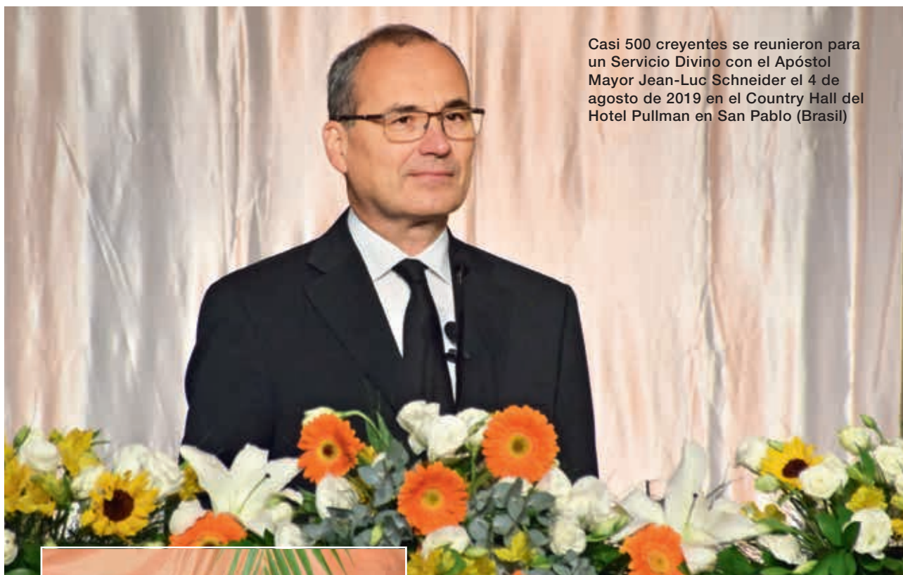
Casi 500 creyentes se reunieron para un Servicio Divino con el Apóstol Mayor Jean-Luc Schneider el 4 de agosto de 2019 en el Country Hall del Hotel Pullman en San Pablo (Brasil)