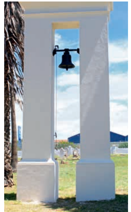
Inaugurado por la Iglesia Reformada Holandesa en 1820, declarado patrimonio cultural provincial en 2000 y usado por la Iglesia Nueva Apostólica desde 2014

En 1817 algunos granjeros pidieron permiso al gobernador Lord Charles Somerset para edificar una iglesia en la región montañosa de Helderberg y construir un pueblo alrededor de ella. La petición fue concedida y en 1819 comenzó la construcción de la iglesia. El 13 de febrero de 1820 el edificio fue consagrado.