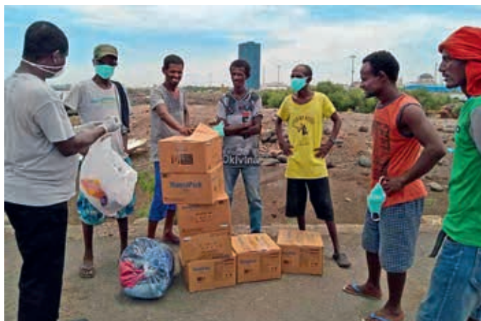
Distribuyendo una ayuda caritativa de human aktiv (INA Alemania del Sur)