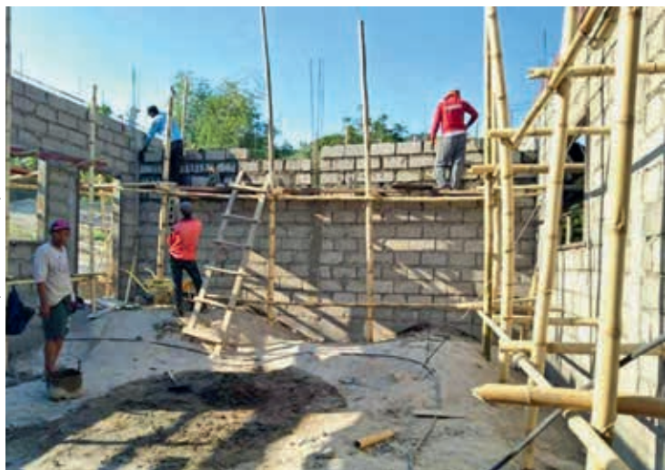
Construyendo con la ayuda de NAC SEA Relief Fund (INA Asia del Sudeste)

Sudáfrica, explica: “Antes del coronavirus, manteníamos nuestros cuatro programas regulares en nuestras áreas marginales (habilidades ilimitadas, espacios seguros después del colegio, sensibilización sobre las adicciones y el hogar infantil Uthandiwe). Cuando el presidente de nuestro país anunció que íbamos a pasar al confinamiento, cerramos inmediatamente todos nuestros centros y suspendimos nuestros cursos de formación, ya que no queríamos que nuestros voluntarios se infectaran”. Después de eso, la institución de ayuda enfocó toda su atención y energía en la provisión de alimentos.