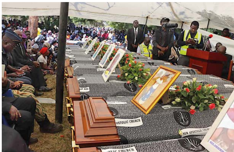
El accidente del ómnibus en Zambia impactó a los hermanos y hermanas en la fe y a gran parte de la población