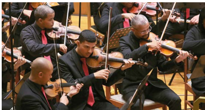
El concierto del sábado por la noche entusiasmó al público internacional en muchos lugares a los que llegó la transmisión

concierto de Pentecostés en la iglesia de conciertos de Silvertown, contribuyó a esta experiencia especial de Pentecostés.