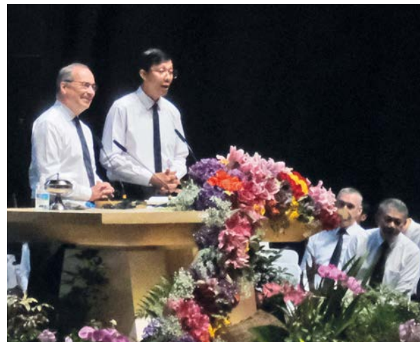
Unos 4.000 hermanos y hermanas en la fe estuvieron presentes en el Servicio Divino con el Apóstol Mayor en un teatro