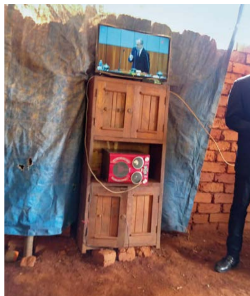
El Servicio Divino es retransmitido por las emisoras de televisión locales