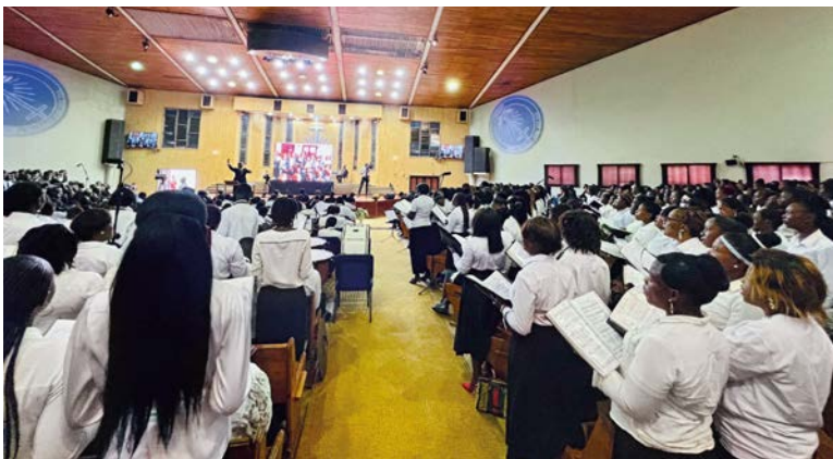
Transmisión del Servicio Divino en Lubumbashi