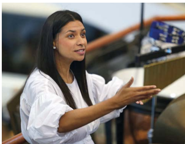
El coro y el coro de niños brindaron su aporte musical al Servicio Divino

Hemos recibido el don del Espíritu Santo, así como Jesucristo, como hombre, recibió el don del Espíritu Santo. El Espíritu Santo estaba con Él. Y se dice que el Espíritu Santo posibilitó a Jesús vencer el mal y resucitar de entre los muertos. Pablo dice que cuando este Espíritu mora en nuestro corazón, podemos hacer lo que a los seres humanos les parece imposible, porque es el mismo poder. Si el Espíritu que permitió a Jesucristo vencer el mal y resucitar de entre los muertos vive en ti, puedes hacer lo que Jesús es-