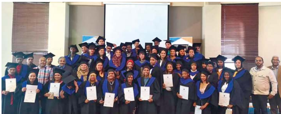
La alegría es grande: estos participantes en los cursos han superado con éxito su formación