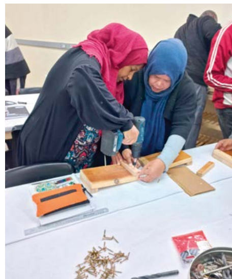
Los jóvenes prueban suerte como informáticos, peluqueros o colocadores de baldosas y azulejos

Masakhe para mejorar mis habilidades porque llevo seis meses desempleada”, dice. Vio la convocatoria en un cartel delante de una Iglesia Nueva Apostólica y se anotó el 30 de enero.